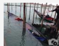
Gondola rovesciata a Venezia