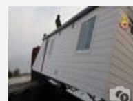
Camion perde carico di cassette prefabbricate