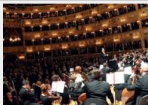
Concerto alla Fenice per i 500 anni del Ghetto (archivio)