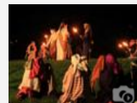
Via crucis a Visome di Belluno